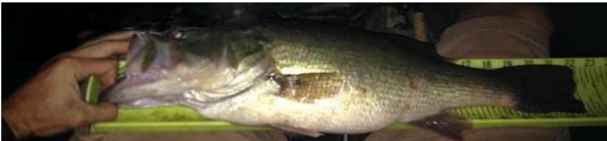
Figura 7 - Penalidade: Este pescador usou a mão para manipular a boca do peixe e claramente não está tocando com a boca fechada. Eles seriam avaliados uma dedução de 3 centímetros ou mais.

Regra 5: Qualquer mão pode ser colocada sobre o corpo ou sobre a placa branquial para segurar o peixe, mas essa mão deve permanecer atrás do olho do peixe.