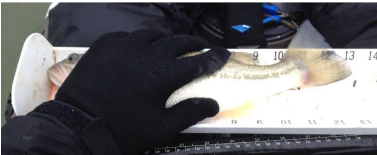
Figura 11 - Penalidade ou Desqualificação: dedução de 3 centímetros ou mais para cada peixe não plano na prancha. Este peixe está em movimento durante a foto. Não é plano na placa e, portanto, difícil julgá-lo seria desqualificado.

Regra 8: A cauda do peixe pode ser pinçada ou natural.