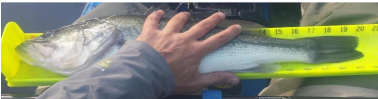
Figura 12 - Este peixe tem a cauda apertada e é uma captura e imagem legais.

Lógica: Beliscar a cauda é permitido e legal, e pode ou não proporcionar uma vantagem ao pescador.