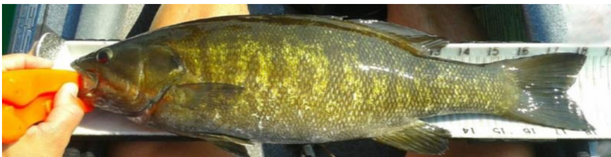
Figura 5 - Penalidade: dedução de 3 centímetros para as mãos, ferramentas de prensão do peixe ou dedos na boca do peixe.

• Nota Adicional: Permitimos que ferramentas de agarre de peixes amarrem a sua captura à embarcação enquanto prepara seu equipamento para uma foto.