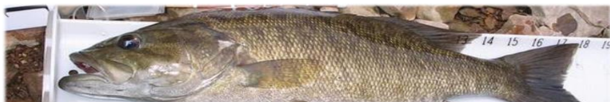
Figura 4 - Penalidade: Este peixe não está a tocar no lado esquerdo da tábua de medição. A penalização seria de até 5 centímetros. Nota: Se um juiz achar que o peixe está a mais de 5 centímetros da saliência, serão aplicadas deduções adicionais.

Regra 2: Deve ser utilizada a régua de medição oficial. Nenhum outro dispositivo de medição será permitido. Além disso, o maxilar inferior e/ou lábio superior do peixe deve estar a tocar o lado esquerdo da placa de colisão. O lábio e a cauda do peixe devem aparecer na foto e o peixe virado para a esquerda na placa de colisão.