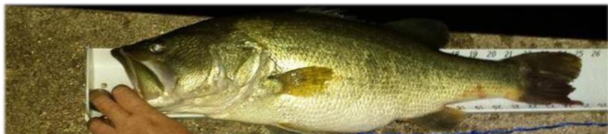
Figura 3 - Desqualificação: Não está claro quando este peixe foi capturado, pois parece estar escuro e, portanto, teria que ser assumido que foi capturado em outro momento que não o da prova.