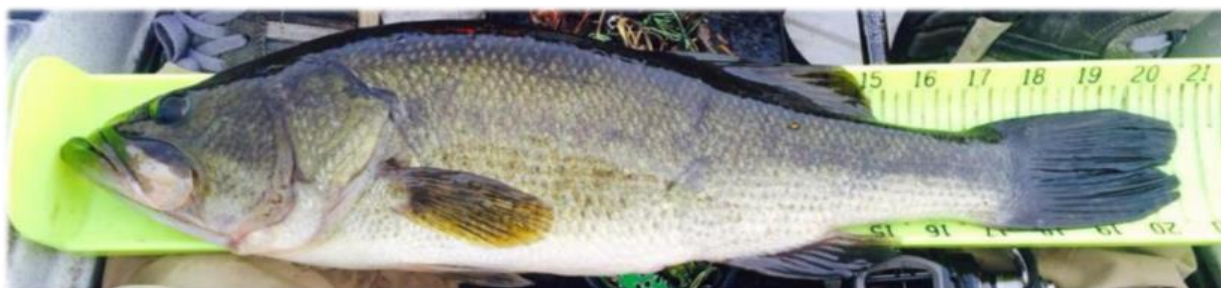
Figura 2 - Desqualificação: Embora esta seja uma imagem perfeita medida em dispositivo de medição aprovado, não há identificação na foto.

- Lógica: Os pescadores devem estar em cima do caiaque. Isso ajuda a garantir que os pescadores não estão a pescar de nenhuma embarcação ilegal durante a competição, e que eles têm o seu caiaque à vista em todas as fotos dos peixes capturados.