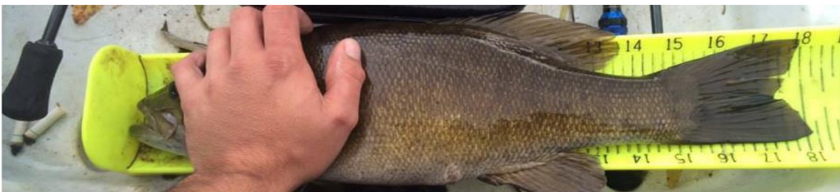
Figura 8 - Penalidade: dedução de 3 centímetros de cada peixe preso indevidamente a bordo.