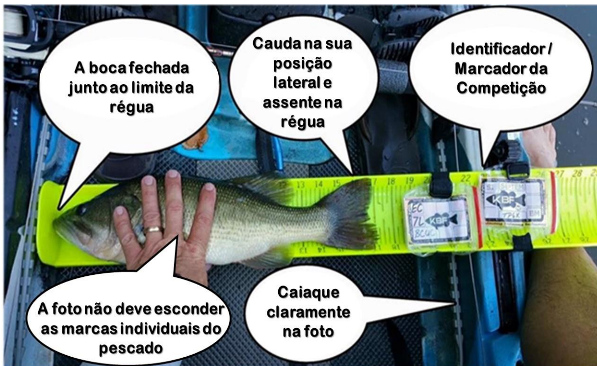
Figura 1 - Regras de medição

Este pescador tem um aparelho de medição homologado, tem o caiaque na fotografia, tem o marcador, e a fotografia é tirada durante o dia. Não está a manipular a boca de forma alguma com as mãos ou