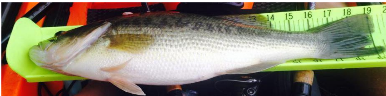
Figura 10 - Este pescador não fotografou o peixe perpendicularmente, o que dificulta a sua identificação.

Nota Adicional: Qualquer peixe que não possa ser claramente identificado estará sujeito a revisão pelos juízes do torneio. Um peixe não pode ser pontuado duas vezes no mesmo dia pelo mesmo pescador no mesmo evento.