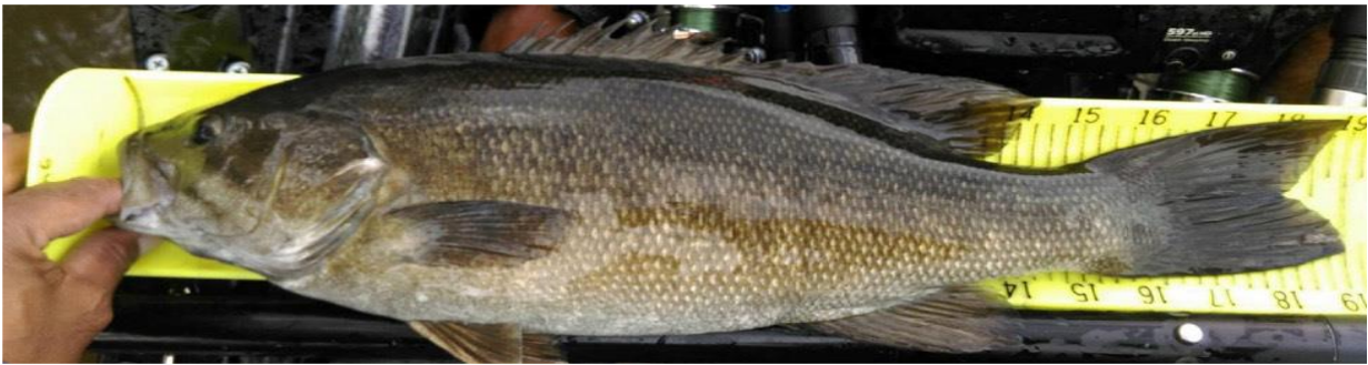
Figura 6 - Penalidade: Este peixe está sendo segurado pelo pescador pela boca. Uma dedução de 3 centímetros seria avaliada nesta foto porque o peixe é segurado pela boca. A mão do pescador precisa ficar atrás do plano do olho.